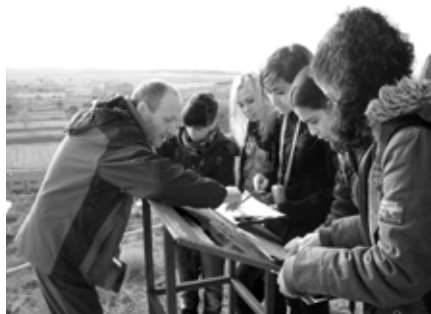
Figura 5. Observant en els plafons la localització de les tropes en el front.

Aquesta proposta és un treball cooperatiu que demana a l'alumnat d'adoptar la posició d'un corresponsal de guerra estranger enviat al cap de pont de Balaguer i fer una crònica per