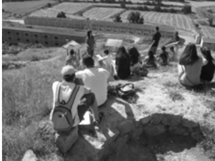
Figura 7. Alumnes atents a les explicacions per construir el rol d'un soldat de la lleva del biberó.