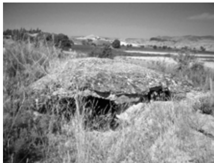
Figura 1. Restes d'estructures bèl·liques del Front del Segre. Carretera Balaguer – Camarasa.

batalla del Segre, i en especial la posició del Merengue, ofereixen un patrimoni arqueològic de la guerra que fan d'aquest espai bèl·lic un marc idoni per articular al seu voltant un discurs comprensible i didàctic sobre aquests fets històrics i avançar cap a plantejaments de la didàctica patrimonial en els espais de memòria.