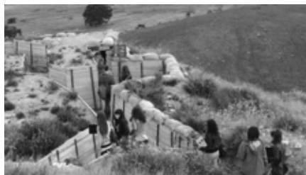
Figura 6. Recorregut per les trinxeres del Merengue.

A partir d'un recull de fonts primàries, es proposa a l'alumnat un treball per a comprendre les conseqüències que van derivar-se de la victòria franquista per a la població de Catalunya: la instauració d'una dictadura militar, l'exili, la repressió política, laboral i cultural, etc.. En concret es treballa l'acondiciament a Balaguer d'uns locals per utilitzar-los com a presó i el nombre de presos que hi van ser reclosos.