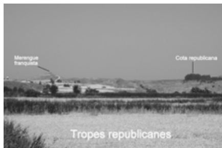
Figura 4. Espai on va desenvolupar-se la Batalla del Merengue, en el Front del Segre.

La visita als espais de memòria de la Batalla del Segre es complementa amb una sèrie d'activitats d'aplicació i consolidació que es desenvoluparan a l'aula amb posterioritat a la visita. Per donar coherència curricular a tota l'activitat, en la realització de les activitats proposades es fomentarà el treball en equip, la gestió i el raonament crític de la informació recopilada i dels aprenentatges adquirits, la capacitat de posar-se en el lloc de l'altre